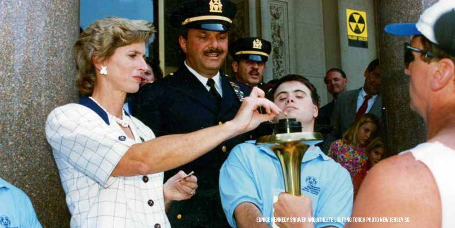
EUNICE KENNEDY SHRIVER AND ATHLETE LIGHTING TORCH PHOTO NEW JERSEY SO