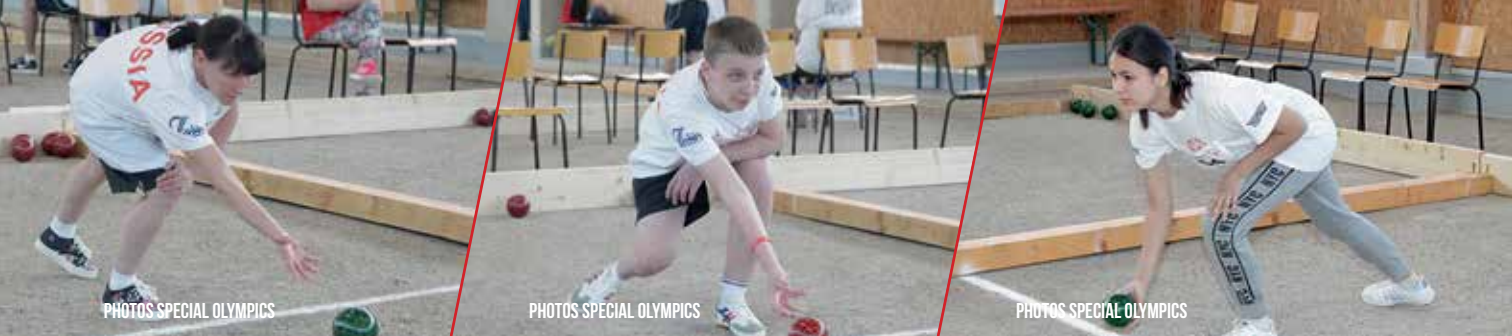
PHOTOS SPECIAL OLYMPICS