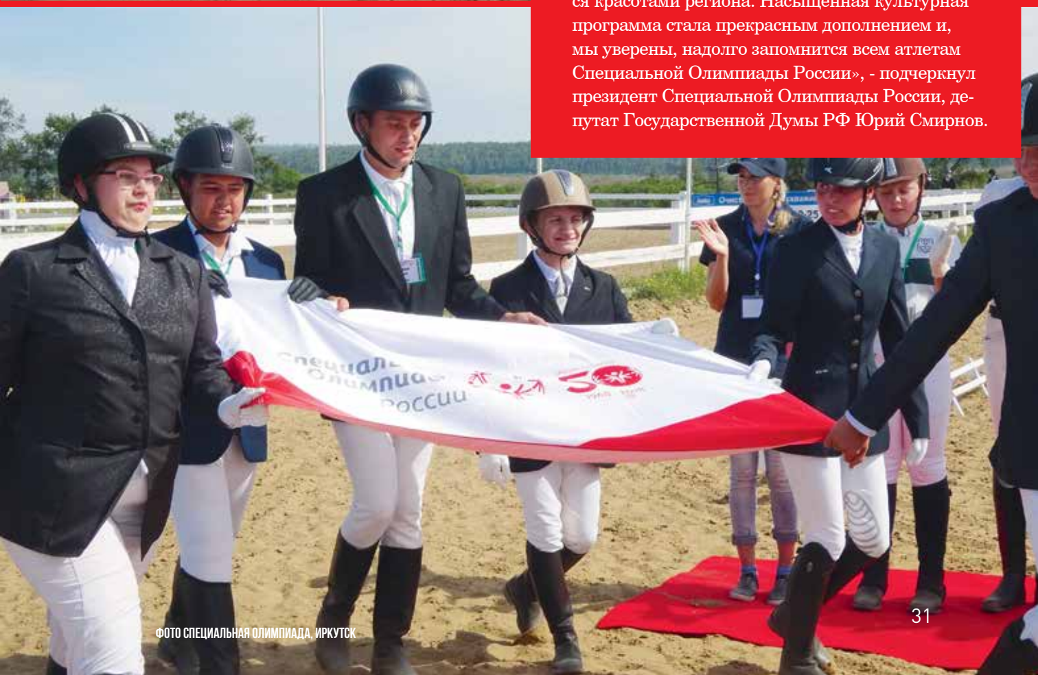
ФОТО СПЕЦИАЛЬНАЯ ОЛИМПИАДА, ИРКУТСК

«Наши спортсмены смогли не только достойно выступить на манеже, но и насладиться красотами региона. Насыщенная культурная программа стала прекрасным дополнением и, мы уверены, надолго запомнится всем атлетам Специальной Олимпиады России», - подчеркнул президент Специальной Олимпиады России, депутат Государственной Думы РФ Юрий Смирнов.