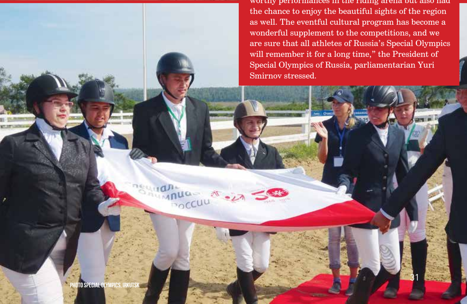
PHOTO SPECIAL OLYMPICS, IRKUTSK