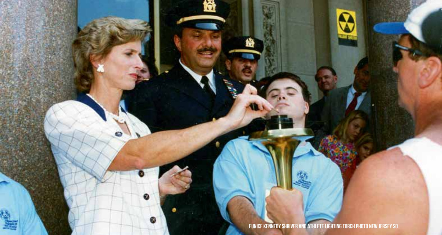
EUNICE KENNEDY SHRIVER AND ATHLETE LIGHTING TORCH PHOTO NEW JERSEY SO